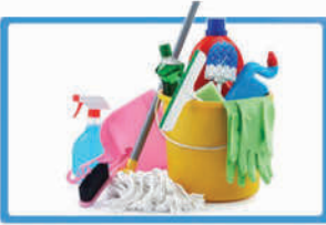
เตรียมอุปกรณ์สำหรับ ทำความสะอาดบ้าน