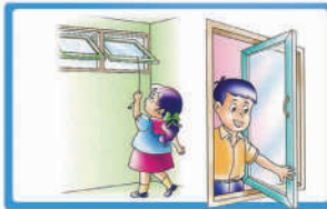
เปิดประตู หน้าต่าง เพื่อระบายอากาศ