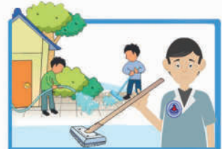
เริ่มทำความสะอาดบ้าน เมื่อน้ำลดถึงระดับข้อเท้า