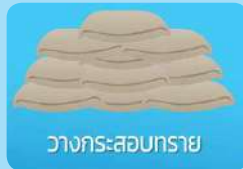
วางกระสอบทราย